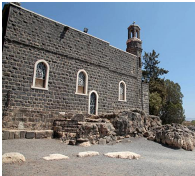
彼得上下船處的小屋